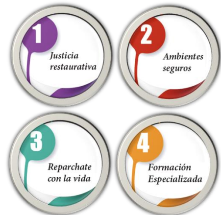
Gráfico 2. Proyecto SYOC Objetivo 1 Cuatro planes que fortalecen al SRPA